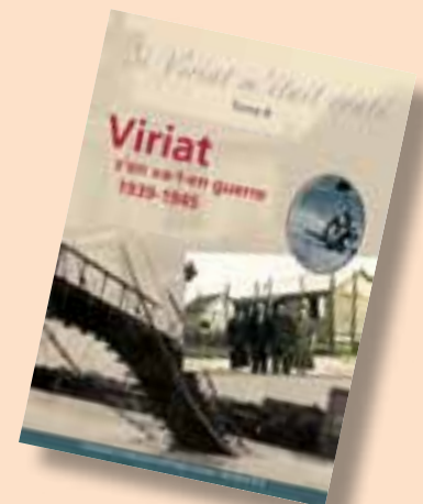
Édité en 650 exemplaires, le livre est en vente à Viriat et Bourg-en-Bresse, au prix de 12 €. ■

Autre projet, même thème : du 6 au 10 mai, une exposition ouverte à tout public, y compris scolaires, sera organisée, avec le concours des associations ACPG et FNACA. ■