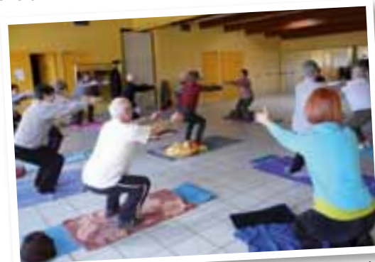
Les activités communes destinées aux personnes retraitées vont se développer.