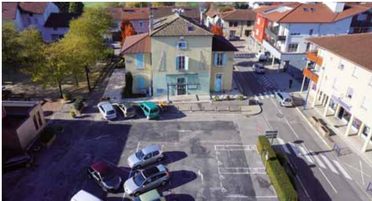
Les espaces de circulation automobile et piétonne seront réaménagés et délimités.