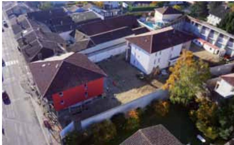
La microcrèche (au rez-de-chaussée du bâtiment blanc) est située à La Neuve, avenue de Mâcon qui a besoin d'être requalifiée.

Depuis le 4 janvier 2016, la microcrèche avenue de Mâcon à La Neuve accueille ses petits pensionnaires âgés de 10 semaines à 3 ans. « C'est le premier service communal décentralisé proposé à Viriat par rapport au centre du village, a commenté Bernard Perret lors des vœux 2016. Il démontre que le développement de notre commune s'organise à partir de deux pôles désormais : le cœur historique, d'une part, et le pôle de La Neuve, d'autre part, aux enjeux plus urbains, nécessitant notamment la requalification de l'avenue de Mâcon. »