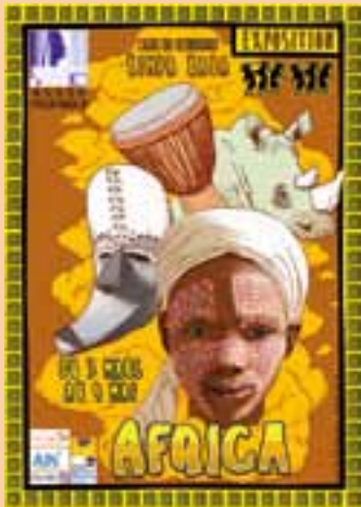
L'Afrique sera à la une de la bibliothèque, avant, pendant et après le Carnaval.

Samedi 19 mars, de nombreux enfants et adultes sont attendus pour célébrer le Carnaval. Les services municipaux enfance-jeunesse et la bibliothèque se sont unis pour préparer l'événement, avec cette année pour thème l'Afrique. Top départ à 9 h 45, salle André Chanel, pour un défilé costumé, avec la participation de l'orchestre junior de l'harmonie et le groupe viriat PC Brass Band. Rendez-vous ensuite autour du Bonhomme Hiver, avec le groupe de percussions Wharma, avant de rejoindre la salle des fêtes pour un spectacle de musique et danses colorées, avec le VIP Ados et Wharma, suivi d'une collation. ■