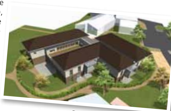
En 2016, les travaux du projet Haïssor vont commencer.

différents acteurs. Le succès de la Semaine Bleue en octobre 2015 le démontre. Le projet Haïssor, quant