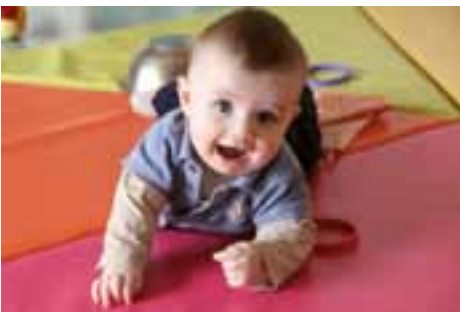
Les petits sont accueillis du lundi au vendredi, de 7 h 30 à 18 h 30.