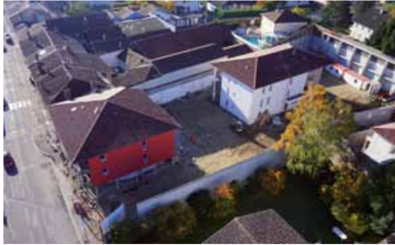
La microcrèche (au rez-de-chaussée du bâtiment blanc) est située à La Neuve, avenue de Mâcon qui a besoin d'être requalifiée.