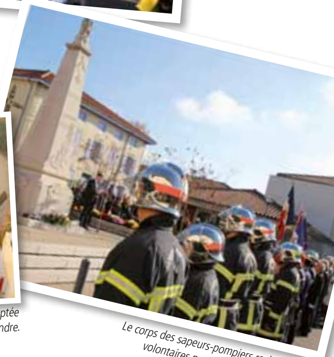
Le corps des sapeurs-pompiers recherche des volontaires pour compléter ses effectifs.

à lui, se concrétise pas à pas. « Ce beau projet intègre au rez-de-chaussée six appartements adaptés avec une salle commune de 60 m 2 , un coin cuisine, un espace informatique, plus trois logements pour les personnes retraitées plus indépendantes. À l'étage, sept logements sont ouverts aux jeunes, a rappelé le maire. Nous faisons le pari du lien intergénérationnel avec une charte d'engagement signée à l'entrée de chaque logement. C'est le pari du bien vivre ensemble. » L'organisation du Téléthon à Viriat, village Téléthon 2016 pour la première fois, promet elle aussi de bons et beaux moments à partager. Le rendez-vous solidaire prévoit 30 heures non-stop d'animations ! Enfin, la refonte de la bibliothèque médiathèque avance. Le lieu d'implantation du nouvel espace culturel est en cours d'identification avec l'aide d'un programmiste qui facilitera le travail de l'architecte. ■