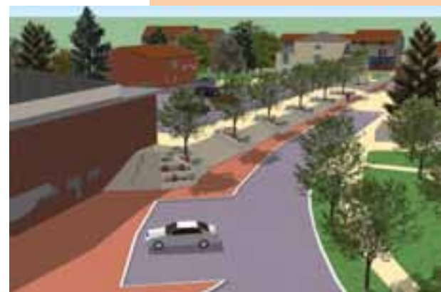
Les premières esquisses, retravaillées par la suite, ont permis d'affiner le projet.