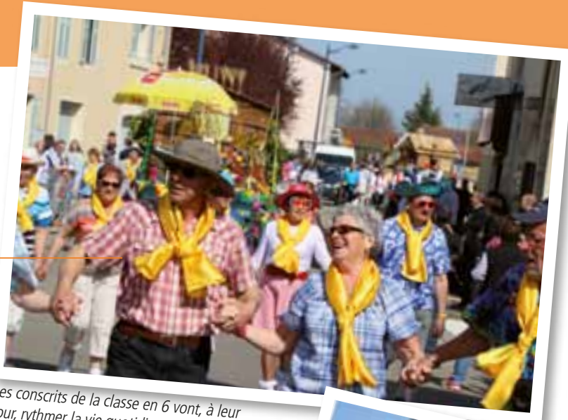
Les conscrits de la classe en 6 vont, à leur tour, rythmer la vie quotidienne viriatie.