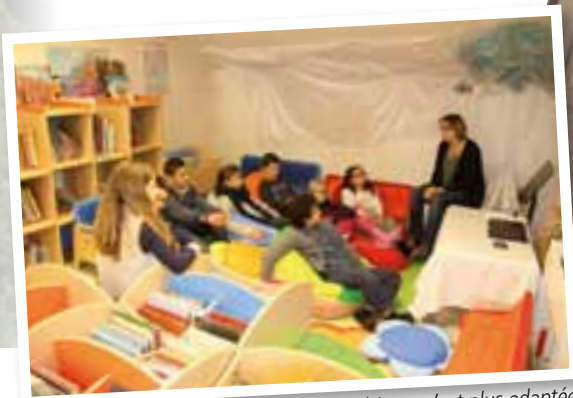
La bibliothèque médiathèque n'est plus adaptée au service qu'elle doit rendre.