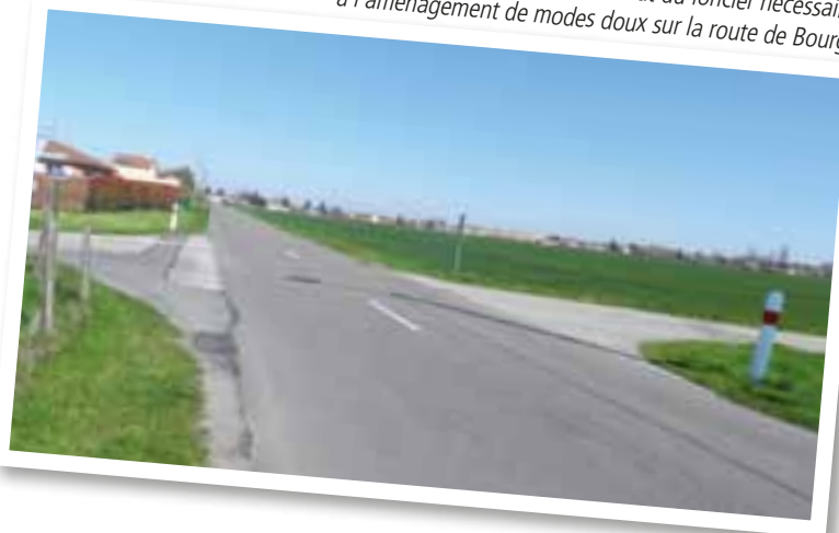
L'année 2016 va être consacrée à l'achat du foncier nécessaire à l'aménagement de modes doux sur la route de Bourg.

à lui, se concrétise pas à pas. « Ce beau projet intègre au rez-de-chaussée six appartements adaptés avec une salle commune de 60 m 2 , un coin cuisine, un espace informatique, plus trois logements pour les personnes retraitées plus indépendantes. À l'étage, sept logements sont ouverts aux jeunes, a rappelé le maire. Nous faisons le pari du lien intergénérationnel avec une charte d'engagement signée à l'entrée de chaque logement. C'est le pari du bien vivre ensemble. » L'organisation du Téléthon à Viriat, village Téléthon 2016 pour la première fois, promet elle aussi de bons et beaux moments à partager. Le rendez-vous solidaire prévoit 30 heures non-stop d'animations ! Enfin, la refonte de la bibliothèque médiathèque avance. Le lieu d'implantation du nouvel espace culturel est en cours d'identification avec l'aide d'un programmiste qui facilitera le travail de l'architecte. ■