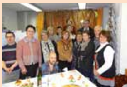
Le 6 janvier, la bibliothèque a réuni et remercié toute son équipe de bénévoles, autour d'un conviviale galette des Rois.