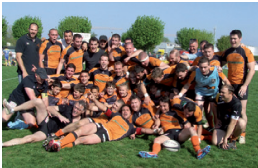
L'équipe 1 (en photo, après sa victoire du 13 avril) et la Réserve sont toutes les deux qualifiées pour la finale du championnat du Lyonnais.