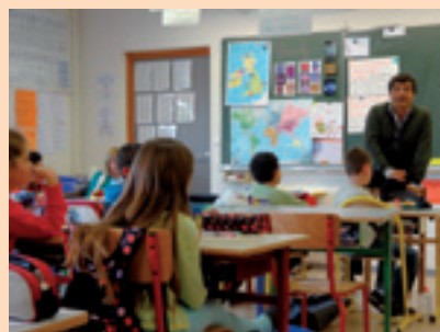
Le 22 avril, l'écrivain voyageur Paul Thiès a rencontré les écoliers de CE2.