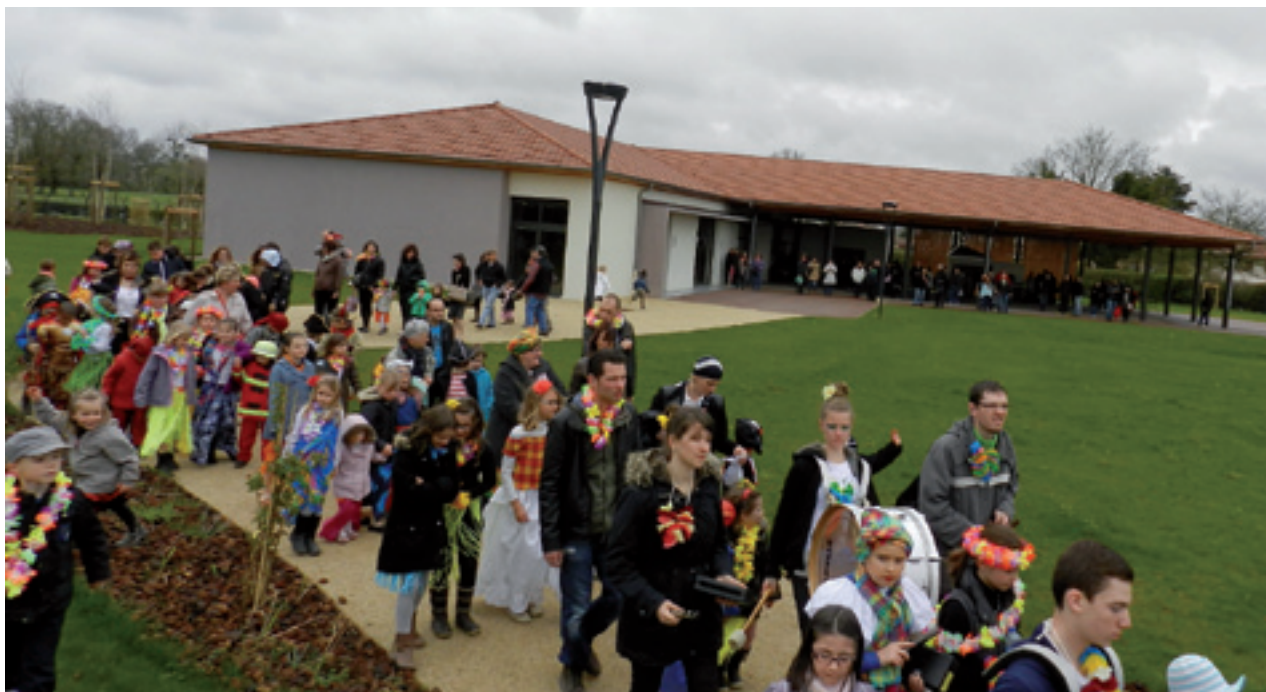
Le solde de l'investissement pour l'aménagement de la Maison des familles s'inscrit au budget 2014. Attendu par la population, le nouvel équipement accueille diverses animations. Rendez-vous y était donné par exemple le 22 avril pour le départ du carnaval.

Aménagement des équipements sportifs, de l'agence postale, construction de la Maison de santé, de la Maison des familles, agrandissement de l'école maternelle, poursuite des acquisitions foncières... Les grands investissements programmés dans le mandat 2008-2014, d'un montant total de plus de 10 M€, ont été réalisés ou sont en cours d'achèvement. Sans pour autant augmenter les taux d'imposition pour les habitants et tout en maintenant une saine capacité d'autofinancement et de désendettement, deux volontés fortes et réaffirmées.