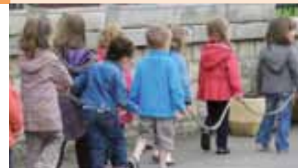
Les enfants de la maternelle se rendent à la cantine.