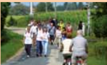
Ambiance assurée cette année encore !

sommes plus disponibles pour eux. De plus, l'accès à la maison de santé est facilité. Nous bénéficions d'un beau parking et nous en remercions la municipalité, car c'est une plus-value énorme pour le cabinet. » Seul bémol : le coût du loyer. « La construction de la maison de santé n'a pas bénéficié de subventions car nous ne sommes pas en zone déficitaire de médecins. » Pour l'heure, les médecins se donnent pour priorité de bien organiser leur lieu de travail, avec le sourire. « Il y a un élan de modernisme qui nous pousse à investir dans de nouveaux matériels, le poste de secrétariat, l'informatisation... On en a pour deux ou trois mois à se roder... » ■