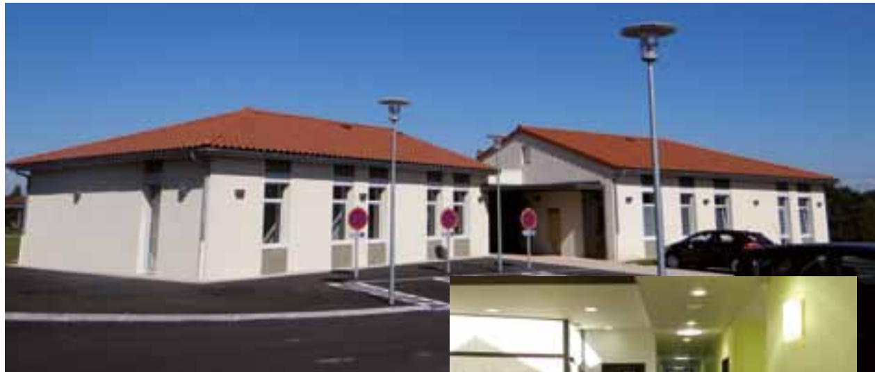
La maison de santé se compose de trois bâtiments de plain-pied.

Le service des espaces verts et le comité du fleurissement de Viriat ont réalisé 16 000 plantations depuis le printemps. Le 7 août, dans le cadre du concours du fleurissement communal, une visite des jardins et maisons fleuries a été organisée. Le tour de la commune a permis de sélectionner les 50 particuliers candidats au concours départemental, selon des critères définis : la couleur, l'harmonie, la propreté... ■