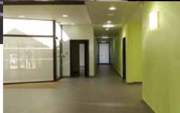
Les trois bâtiments sont reliés par un hall d'accueil de 85 m².