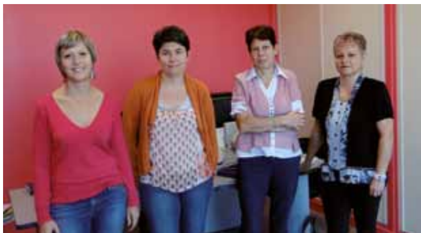
Les quatre infirmières installées dans leur nouveau cabinet.