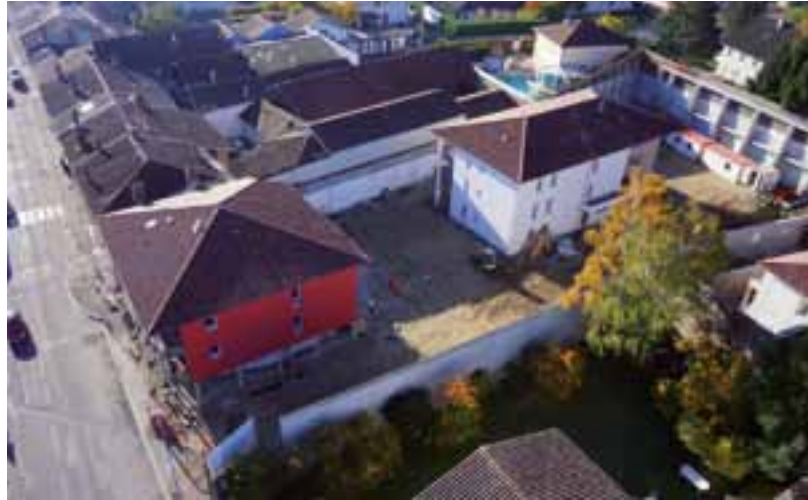
La microcrèche (au rez-de-chaussée du bâtiment blanc) est située à La Neuve, avenue de Mâcon qui a besoin d'être requalifiée.

Depuis le 4 janvier 2016, la microcrèche avenue de Mâcon à La Neuve accueille ses petits pensionnaires âgés de 10 semaines à 3 ans. « C'est le premier service communal décentralisé proposé à Viriat par rapport au centre du village, a commenté Bernard Perret lors des vœux 2016. Il démontre que le développement de notre commune s'organise à partir de deux pôles désormais : le cœur historique, d'une part, et le pôle de La Neuve, d'autre part, aux enjeux plus urbains, nécessitant notamment la requalification de l'avenue de Mâcon. »