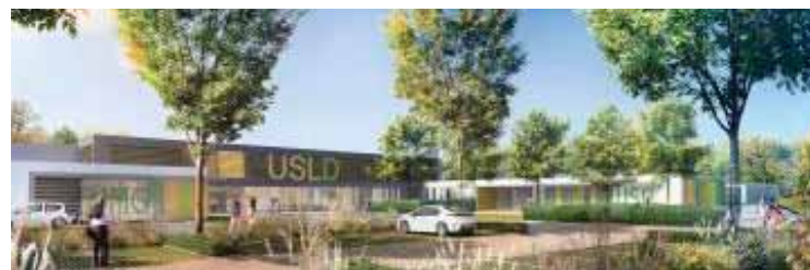
Dans le parc de l'hôpital, la nouvelle Unité de soins de longue durée disposera de 132 lits répartis en six unités.

Les premières pierres ont été posées fin 2015 pour une mise hors d'eau hors d'air du bâtiment fin 2016 et une livraison mi-2017. La nouvelle USLD accueillera tout d'abord les services d'hébergement de l'hôpital, en raison des travaux de réhabilitation du bâtiment principal. Les services