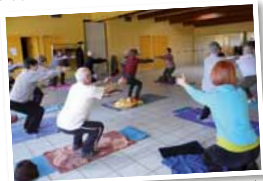
Les activités communes destinées aux personnes retraitées vont se développer.