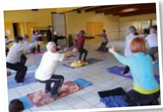
Les activités communes destinées aux personnes retraitées vont se développer.