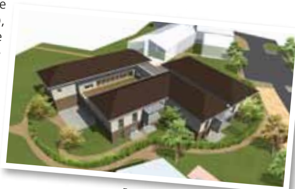
En 2016, les travaux du projet Haïssor vont commencer.

différents acteurs. Le succès de la Semaine Bleue en octobre 2015 le démontre. Le projet Haïssor, quant