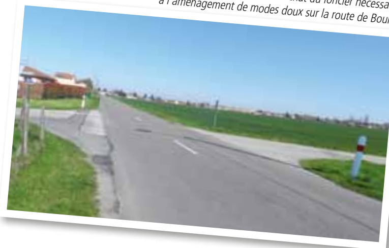
L'année 2016 va être consacrée à l'achat du foncier nécessaire à l'aménagement de modes doux sur la route de Bourg.

à lui, se concrétise pas à pas. « Ce beau projet intègre au rez-de-chaussée six appartements adaptés avec une salle commune de 60 m 2 , un coin cuisine, un espace informatique, plus trois logements pour les personnes retraitées plus indépendantes. À l'étage, sept logements sont ouverts aux jeunes, a rappelé le maire. Nous faisons le pari du lien intergénérationnel avec une charte d'engagement signée à l'entrée de chaque logement. C'est le pari du bien vivre ensemble. » L'organisation du Téléthon à Viriat, village Téléthon 2016 pour la première fois, promet elle aussi de bons et beaux moments à partager. Le rendez-vous solidaire prévoit 30 heures non-stop d'animations ! Enfin, la refonte de la bibliothèque médiathèque avance. Le lieu d'implantation du nouvel espace culturel est en cours d'identification avec l'aide d'un programmiste qui facilitera le travail de l'architecte. ■