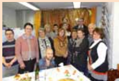
Le 6 janvier, la bibliothèque a réuni et remercié toute son équipe de bénévoles, autour d'un conviviale galette des Rois.