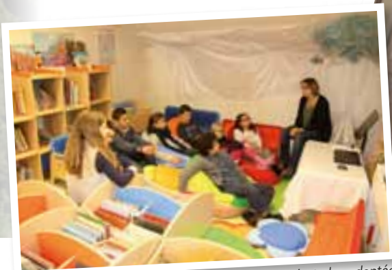
La bibliothèque médiathèque n'est plus adaptée au service qu'elle doit rendre.