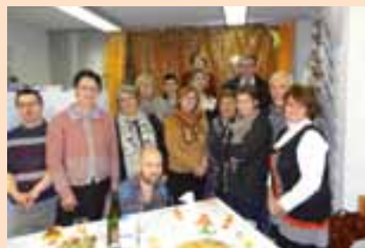
Le 6 janvier, la bibliothèque a réuni et remercié toute son équipe de bénévoles, autour d'un conviviale galette des Rois.