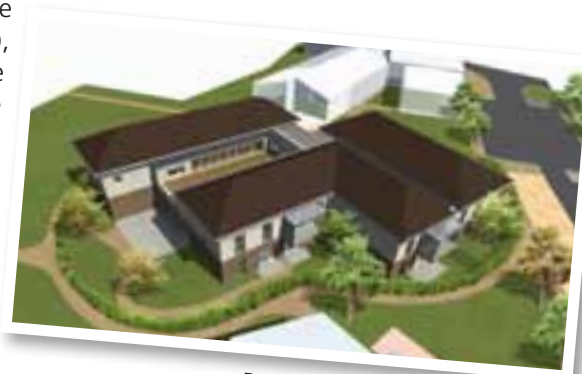
En 2016, les travaux du projet Haïssor vont commencer.

différents acteurs. Le succès de la Semaine Bleue en octobre 2015 le démontre. Le projet Haïssor, quant