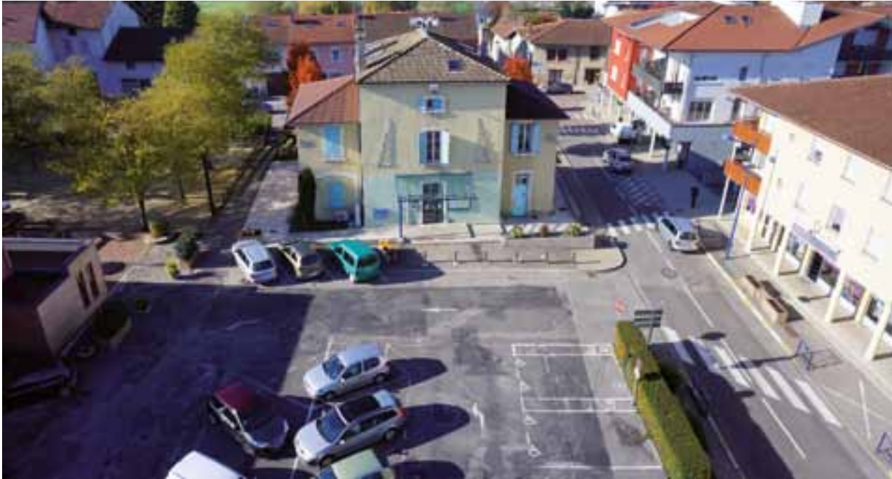
Les espaces de circulation automobile et piétonne seront réaménagés et délimités.