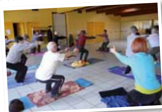
Les activités communes destinées aux personnes retraitées vont se développer.