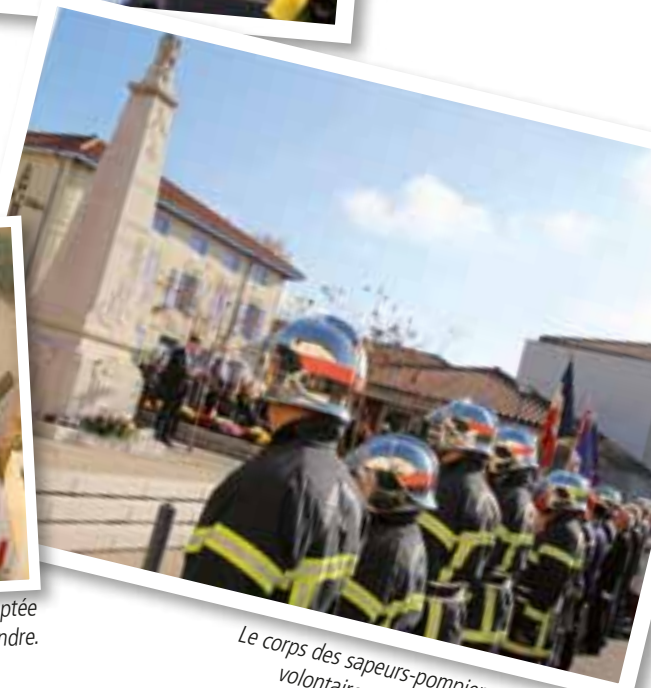
Le corps des sapeurs-pompiers recherche des volontaires pour compléter ses effectifs.

à lui, se concrétise pas à pas. « Ce beau projet intègre au rez-de-chaussée six appartements adaptés avec une salle commune de 60 m 2 , un coin cuisine, un espace informatique, plus trois logements pour les personnes retraitées plus indépendantes. À l'étage, sept logements sont ouverts aux jeunes, a rappelé le maire. Nous faisons le pari du lien intergénérationnel avec une charte d'engagement signée à l'entrée de chaque logement. C'est le pari du bien vivre ensemble. » L'organisation du Téléthon à Viriat, village Téléthon 2016 pour la première fois, promet elle aussi de bons et beaux moments à partager. Le rendez-vous solidaire prévoit 30 heures non-stop d'animations ! Enfin, la refonte de la bibliothèque médiathèque avance. Le lieu d'implantation du nouvel espace culturel est en cours d'identification avec l'aide d'un programmiste qui facilitera le travail de l'architecte. ■